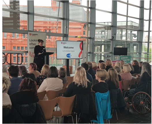
Rydym yn ymgyrchu'n ddi-baid i wneud bywyd yn well i ofalmwr.

Rydym yn gwybod mai gofalmwr yw'r arbenigwyr yn eu bywydau eu hunain, felly rydym yn gweithio mewn partneriaeth â gofalmwr i sicrhau bod eu lleisiau'n cael eu clywed, ac i ddylanwadu ar y polisiau a'r gwasanaethau sy'n effeithio'n uniongyrchol arnynt. Mae hyn yn cynnwys ymgysylltu â Gweinidogion a swyddogion Llywodraeth Cymru, Aelodau'r Senedd, y GIG, cynghorau a sefydliadau sy'n ymwneud â gofal cymdeithasol, a gwneud gwaith ymchwil i helpu i godi ymwybyddiaeth y cyhoedd o'r heriau sy'n wynebu gofalmwr.